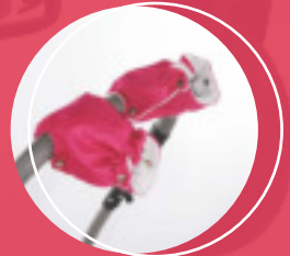
REKAWICE DLA OPIEKUNA komfort użytkowania zimą