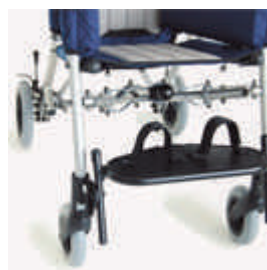
827 mocowanie stóp