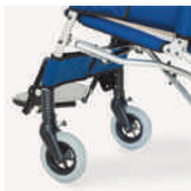
812 blokady kierunkowe kół