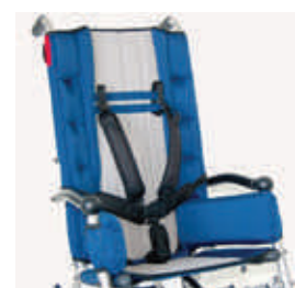
906 pas 5-punktowy