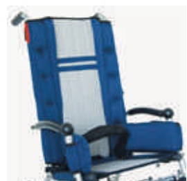
894 pas biodrowy