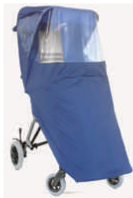
825 osłona przeciwdeszczowa