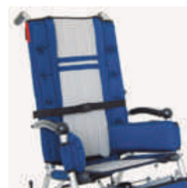
828 pas piersiowy