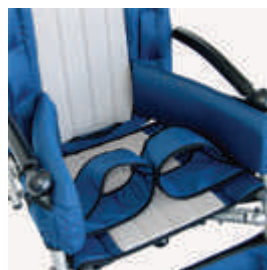
817 pasy odwodzące