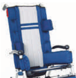
816 podpory boczne