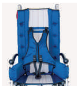
903 kamizelka petna