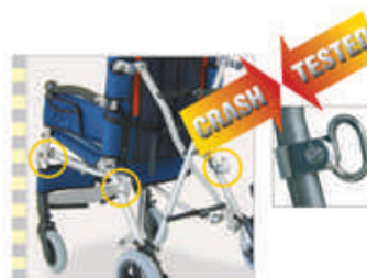
891 mocowanie do transportu