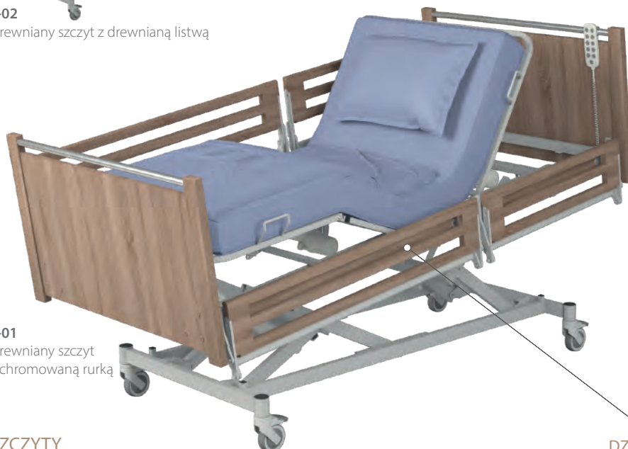
L-01 Drewniany szczyt z chromowaną rurką