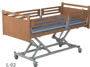
L-02 Drewniany szczyt z drewnianą listwą